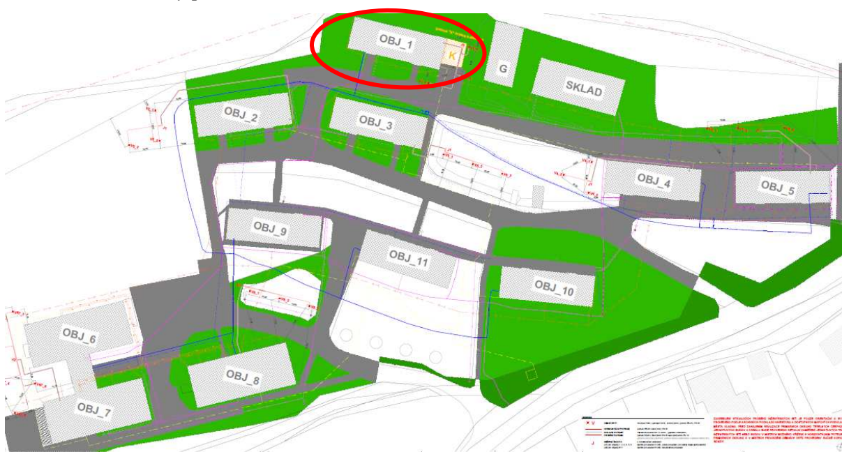
Obrázek 2 – Koordinační situace areálu Domovu Kladno – Švermov – vyznačený objekt 1